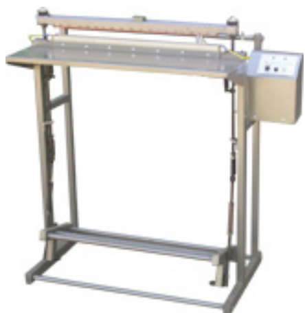
МСН-1000М-2Н - Модификация напольного сварщика МСП-1000М с широким рабочим столом